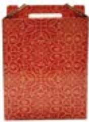
Caja cartón decorada 3 botellas EMBALAJES PETIT Ref.: 50990

Los lotes navideños siempre son un regalo que causa admiración y es un motivo de reconocimiento a quien se le entrega. Para hacer el lote más atractivo, disponemos de cajas de diferentes tamaños y motivos decorativos.