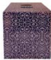
Caja cartón decorada 9 botellas EMBALAJES PETIT Ref.: 50993