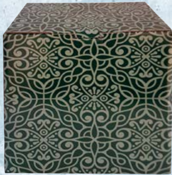
Caja cartón decorada 6 botellas EMBALAJES PETIT Ref.: 50992